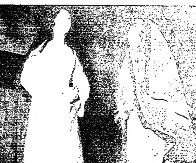
مشهد من المسرحية

الفكرة الرئيسية في المسرحية تدور حول المرأة .. كيف ينظر اليها الرجل ؟ كيف يتعامل مع النصف الاخر ؟ اين مكانها في حياته ووجوده ؟